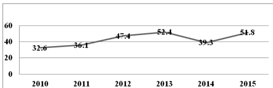
Рис. 1. Инвестиции в сельское хозяйство за 2010–2015 гг.

ства РФ от 14 июля 2012 г. № 717 (ред. от 19 декабря 2014 г.) «О Государственной программе развития сельского хозяйства и регулирования рынков сельскохозяйственной продукции, сырья и продовольствия на 2013–2020 годы» [5].