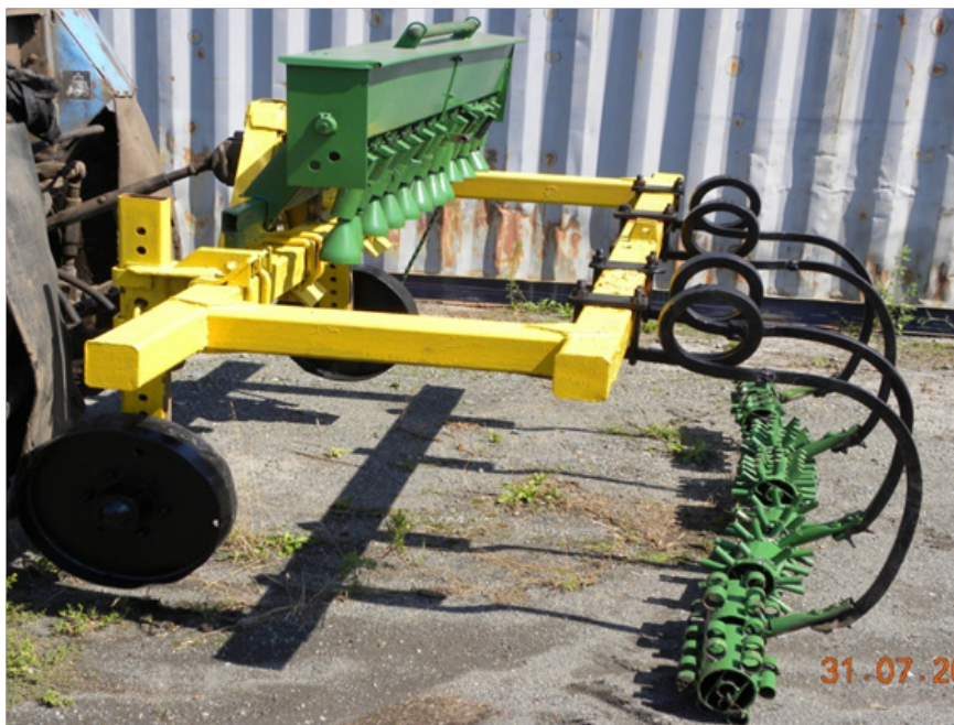
Рис. 2. Агрегат для подсева семян трав на горные луга и пастбища с последующим прикатыванием Fig. 2. Unit for sowing grass seeds on mountain meadows and pastures with subsequent rolling