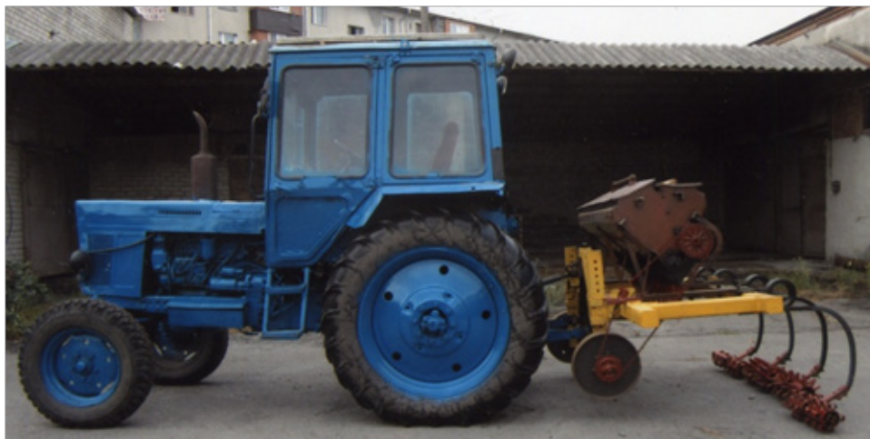
Рис. 4. Общий вид опытного образца агрегата для внесения минеральных удобрений с последующим прикатыванием Fig. 4. General view of the prototype unit for applying mineral fertilizers with subsequent rolling

В многолетних опытах лаборатории горного луговодства только внесение полной дозы минерального удобрения на горных лугопастбищах субальпийского пояса ( N_{120}P_{90}K_{40} ) обеспечило стабильно высокий урожай (41,1 ц/га СВ), в то время как на неудобранных пастбищах продуктивность составляла 11,5–16,0 ц/га.