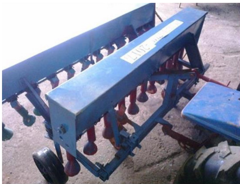
Рис. 3. Агрегат для подсева травосмесей на горные луга и пастбища Fig. 3. Unit for sowing grass mixtures on mountain meadows and pastures

Кроме того, для улучшения горных лугов и пастбищ сконструирован и опробован агрегат для подсева травосмесей: бобовых и злаковых (рис. 3).