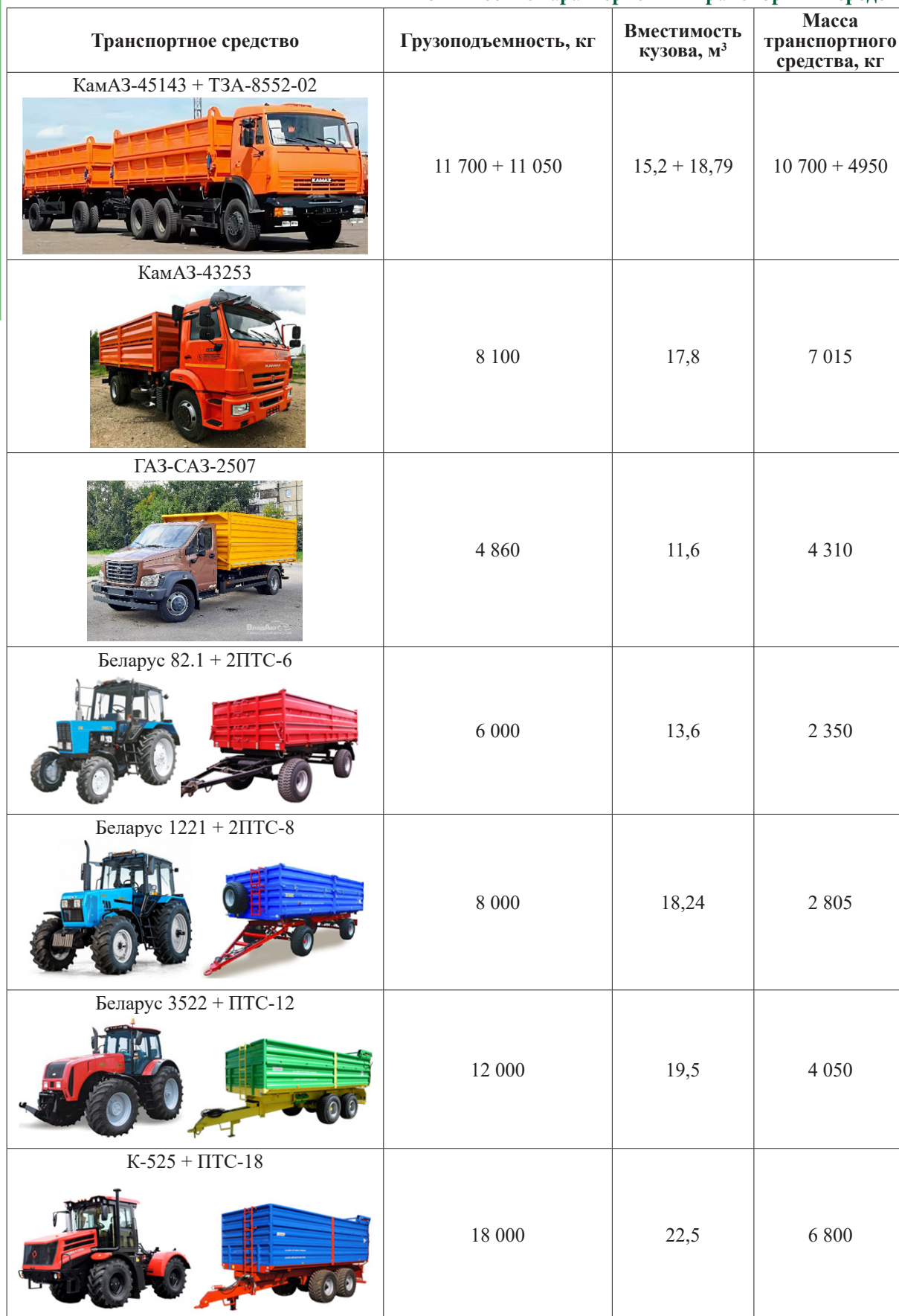
Таблица 2 Технические характеристики транспортных средств