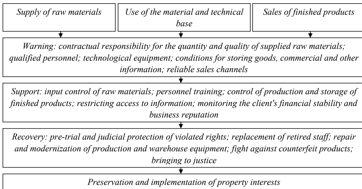
Fig. 1. Algorithm for protecting property interests

2. При преобразовании благ в готовую продукцию: соблюдение технологии производства; соблюдение контроля качества изготовленной продукции; обеспечение условий хранения продукции: температурно-влажностный режим, система пожарно-охранной сигнализации, видеонаблюдение, ограничение доступа персонала в различные помещения; соблюдение режима секретности в работе с конфиденциальной информацией.